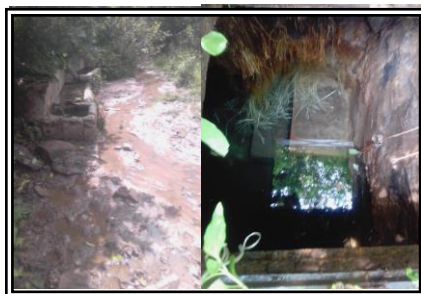
Figura 1. Arroyo y pozo de agua

De las muestras analizadas para Pseudomonas spp se puede observar en la Figura 2 la fluorescencia de las membranas en Agar Cetrimida bajo luz ultravioleta; resultando positivo a un 100%. En la Tabla número 2 se observa los resultados obtenidos para este microorganismo confirmando la fluorescencia que presentaron las membranas, al realizar la tinción Gram se identifican bacilos Gramnegativos, y las pruebas bioquímicas de Oxidasa y Catalasa fueron positivas. Confirmando la presencia de este microorganismo en el agua de Camichines Jalisco.